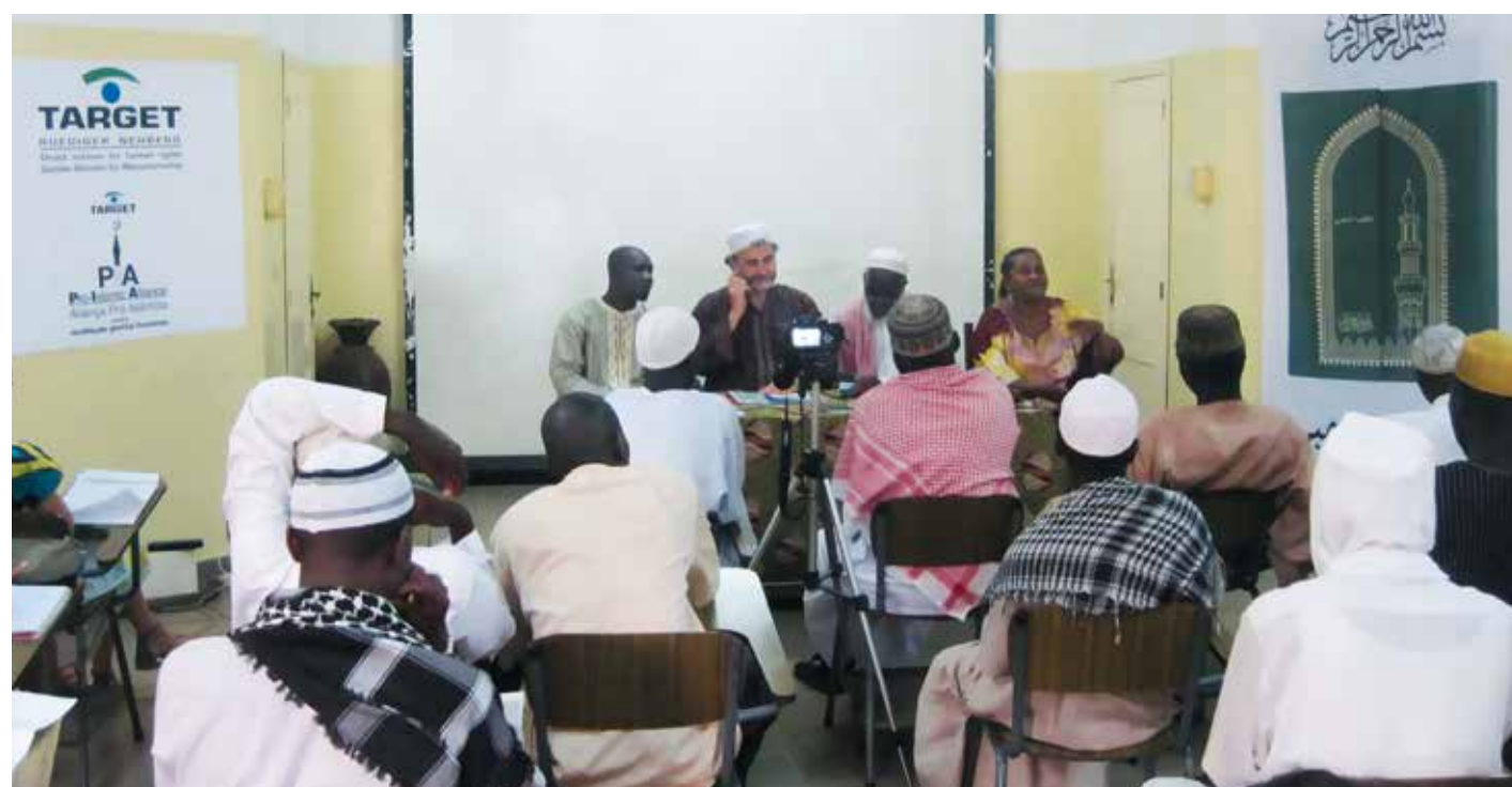
Dialog-Übungen vor laufender Kamera

So vorbereitet, sind seit Juli zwei Teams unterwegs. Sie bestehen aus Imamen, einem Assistenten und einem Fahrer, betreut von einem TARGET-Team. Wir freuen uns sehr über die praktische Unterstützung durch die örtlichen Organisationen DJINOPI/WFD und ACODE.