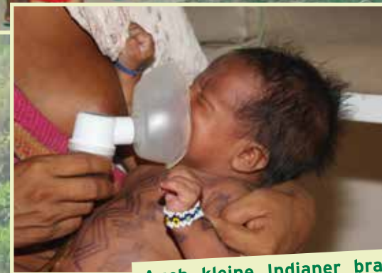
Auch kleine Indianer brauchen manchmal eine Inhalation, wenn sie erkältet sind.