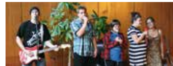
Zur 50-Jahr-Feier der Peter-Jordan-Schule Mainz wird ein Benefizkonzert der Schulband veranstaltet.