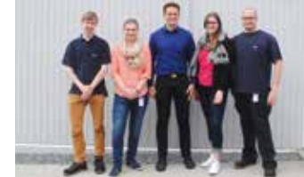
Das „Soziale Projekt“ der ideenreichen Auszubildenden der Drägerwerk AG & Co. KGaA/Lübeck kommt in diesem Jahr unserer Geburtshilfeklinik zugute.