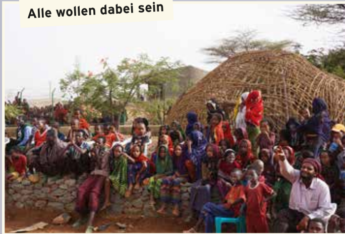
Alle wollen dabei sein