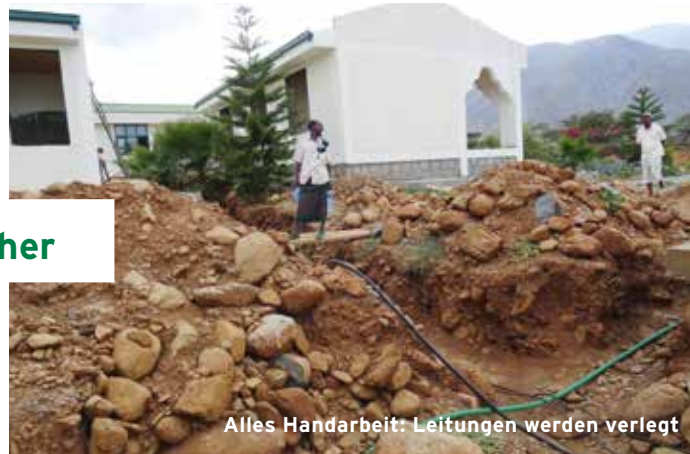
Alles Handarbeit: Leitungen werden verlegt