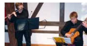
20 Jahre Gleichstellungsstelle Gemeinde Trittau - Benefizkonzert mit dem Duo Quergestreift.