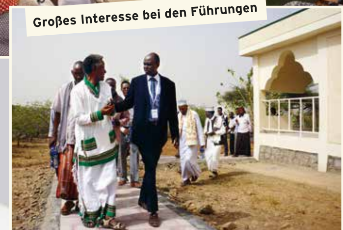
Großes Interesse bei den Führungen