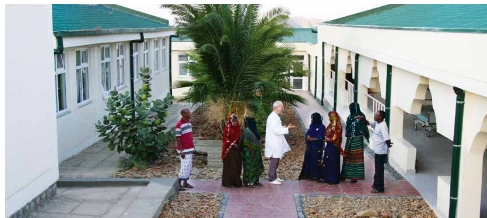
Blick auf einen Teil der Anlage: li. Anmeldung, dahinter ein Mitarbeiterhaus, re. Entbindung mit gynäkologischer Ambulanz, hinten der Stationstrakt

Die Klinik bietet professionelle Hilfe für die genital verstümmelten Mädchen und Frauen. Die Folgeleiden der früher hier üblichen und aufgrund unserer Arbeit rückläufigen Verstümmelung sind unvorstellbar, die Geburten gefährlich für Mutter und Kind. Die tägliche Sprechstunde in der gynäkologischen Ambulanz wird gut angenommen, operative Eingriffe werden durchgeführt, Kaiserschnitte sind möglich. Schwangerschafts-Vorsorge ist für die Afar-Frauen noch neu. So freuen sie sich, ein Ultraschallbild des Babys mit nach Hause nehmen zu können - beste Mund-zu-Mund-Propaganda. Mittlerweile konnten wir schon vielen Babys und ihren Müttern in der Klinik eine sichere Geburt ermöglichen.