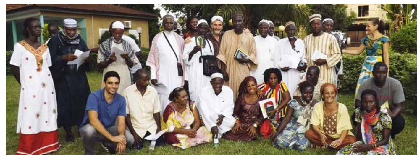
Das TARGET-Team von Guinea-Bissau mit Teilnehmern der Fortbildungstage