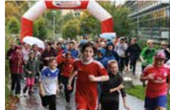
Die Realschule Zirndorf veranstaltet einen Sponsorenlauf.