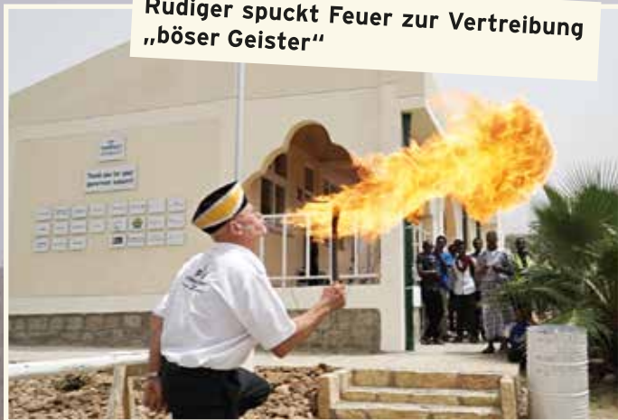
Rüdiger spuckt Feuer zur Vertreibung „böser Geister“