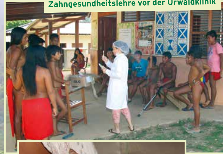
Zahngesundheitslehre vor der Urwaldklinik