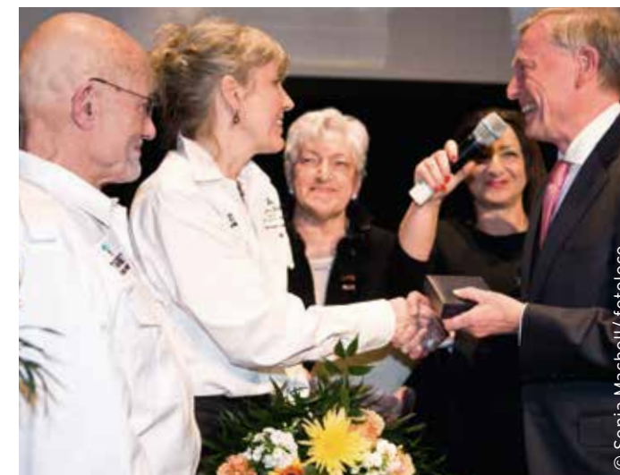
Überreichung der Urania-Medaille durch Bundespräsident a. D. Prof. Dr. Horst Köhler