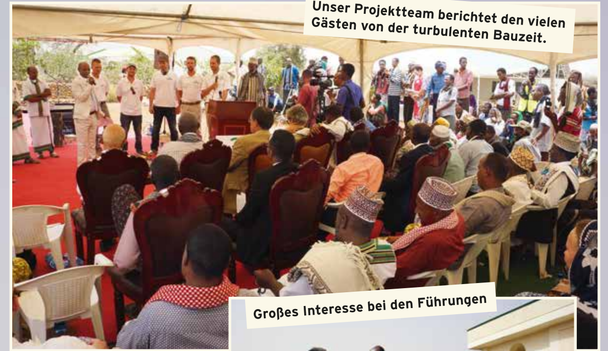
Unser Projektteam berichtet den vielen Gästen von der turbulenten Bauzeit.