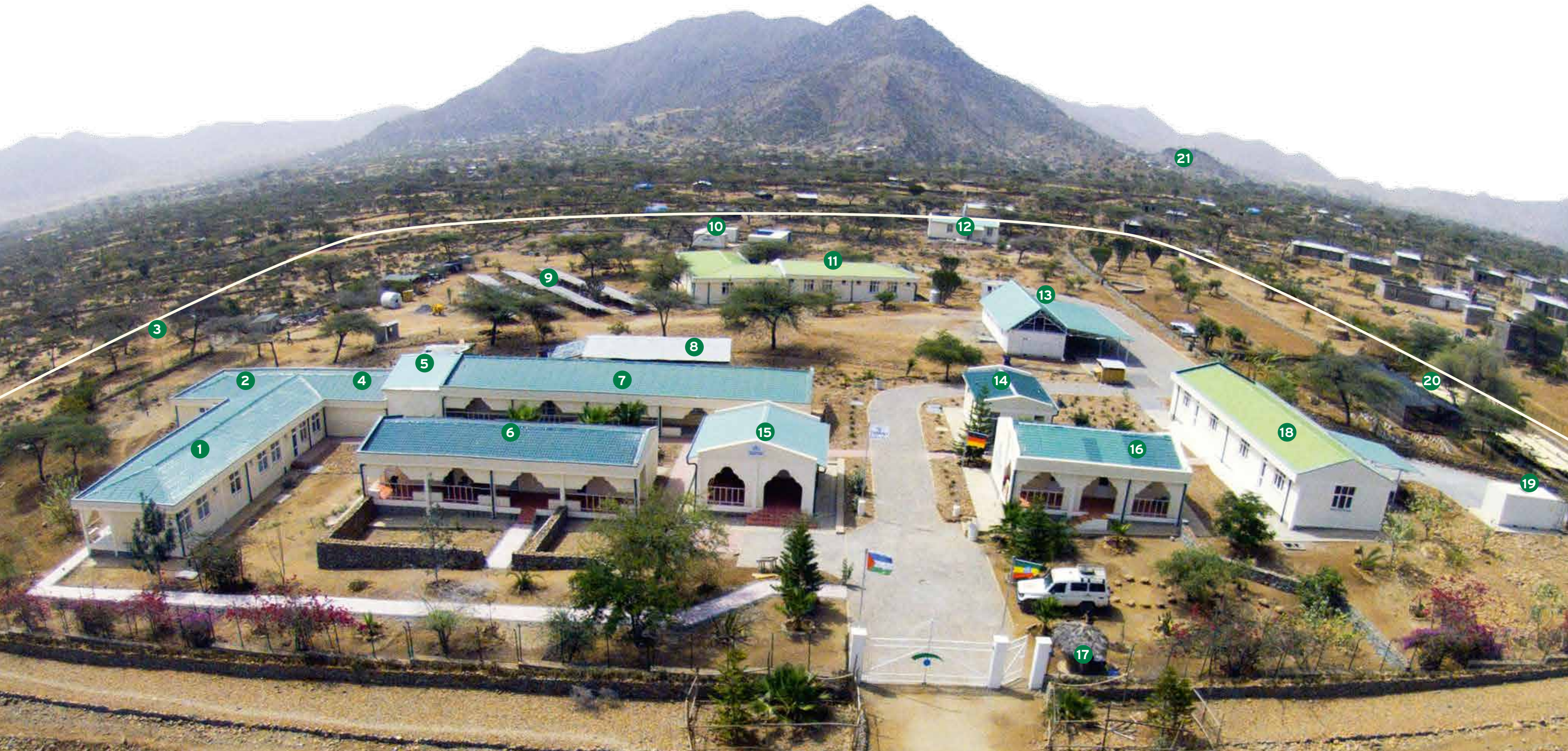
1: Patientinnen stationär 2: Operationssäle 3: Kläranlage/Verbrennung 4: Sterilisation 5: Lagerräume 6: Mitarbeiterhaus 7: Entbindungsräume/Gynäkologische Ambulanz/Labor 8: Lager Baumaterialien 9: Photovoltaik-Feld 10: Container für künftigen Wohnraum Mitarbeiter 11: Wohnhaus med. Mitarbeiter 12: Mitarbeiterhaus 13: Versorgungshaus aus Containern: Wasseraufbereitung/Batterien PVA/Werkstatt/Wohn-