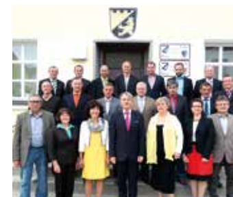
Die Mitglieder des Gemeinderats Berg bei Neumarkt verzichten auf die Aufwandsentschädigung der Weihnachtssitzung.