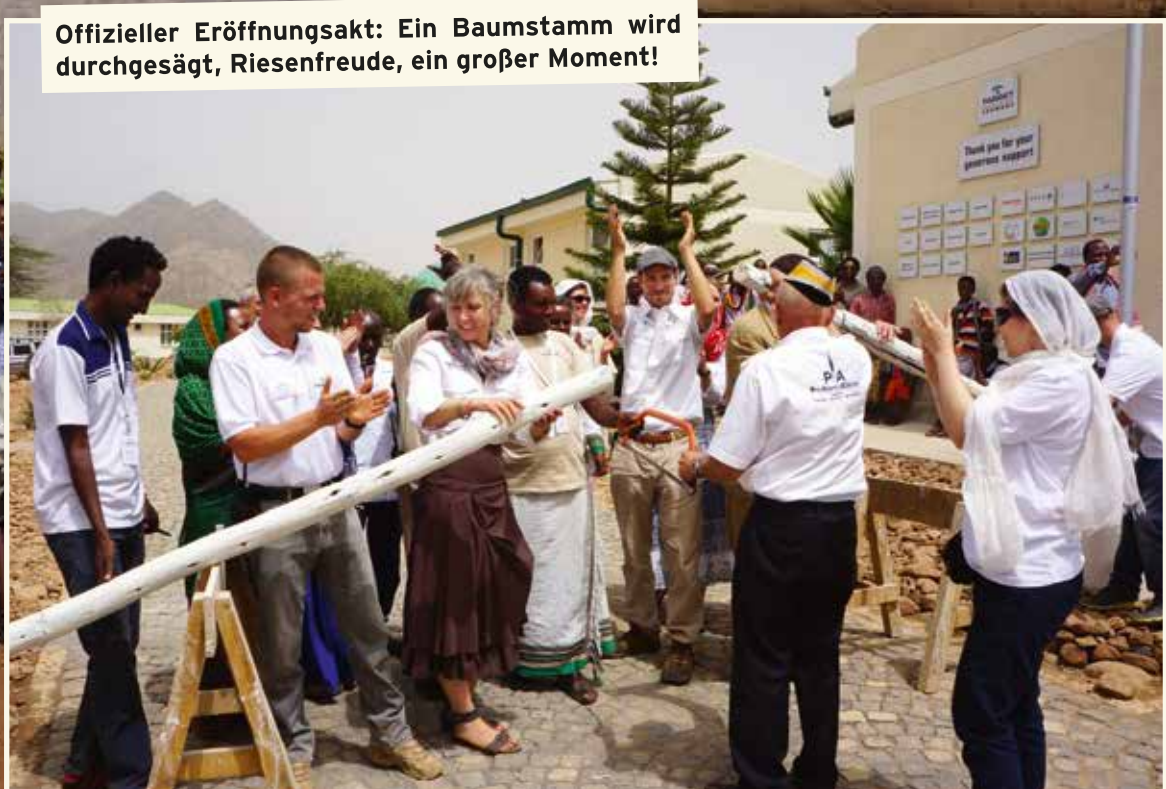
Offizieller Eröffnungsakt: Ein Baumstamm wird durchgesägt, Riesenfreude, ein großer Moment!